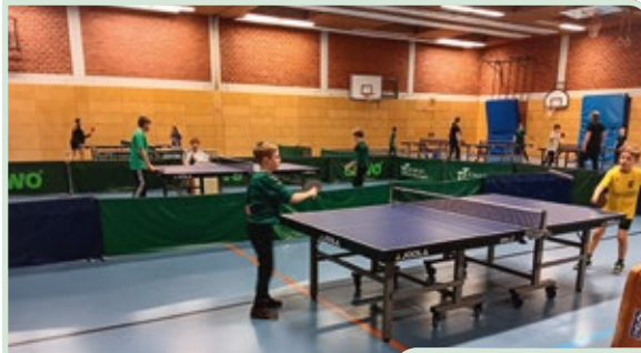
Turnier-Atmosphäre wie bei den Großen!

Unsere neue Jugendmannschaft hat ihr erstes Punktespiel erfolgreich beendet. Mit 7:3 gewannen sie gegen die gemischte Jugendmannschaft von Burgthann. Gemischt deswegen, weil unsere Gegner zum Teil mit erfahrenen Spielern angetreten sind und auch mit Spielern, die – wie wir auch – erst seit kurzem an der Platte stehen. Wichtiger als der Sieg war aber die gute Stimmung und der Spaß am Spiel, den alle sichtlich hatten.