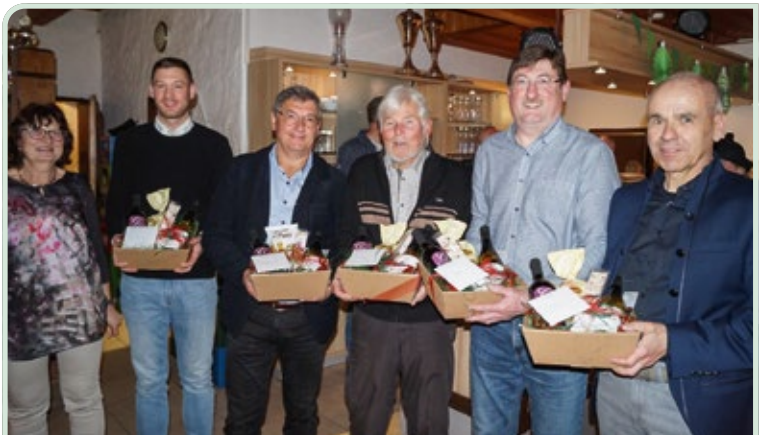
Ehrung des „alten“ Vorstandes

Die neu gewählte Vorstandschaft bedankte sich bei den scheidenden Funktionären für ihr erbrachtes Engagement und überreichte Präsentkörbe.