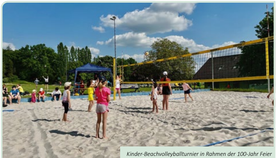
Kinder-Beachvolleyballturnier in Rahmen der 100-Jahr Feier