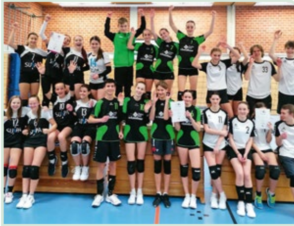
Siegreiche FCEler beim Kinder und Jugendturnier in Burghann

Bis in den März hinein war die U13 weiblich noch im Spielbetrieb. Mit deren letzten Turnier in Höchststadt/Aisch ist nun für alle sechs Nachwuchsmannschaften die Saison vorbei. Ab sofort beginnen für die Trainer daher bereits die Planungen für die neue Saison. Ziel ist es, wieder vielen Kindern und Jugendlichen die Möglichkeit eines aktiven Wettkampfes zu ermöglichen und in Vorbereitung darauf möglichst altersgerechtes Training anzubieten.