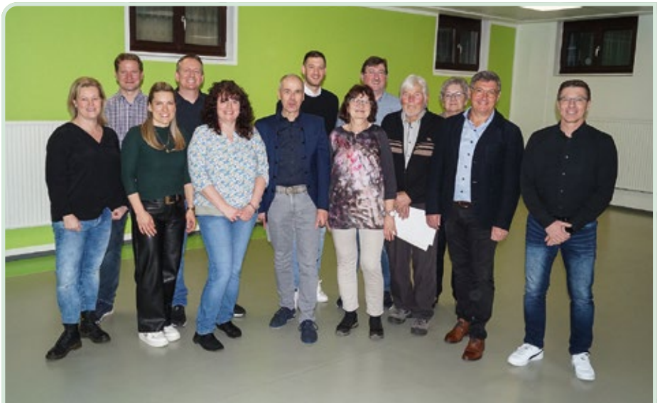
Bild mit alter und neuer Vorstandschaft