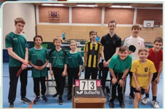
Alle Teilnehmer des Jugend-Freundschaftsspiels