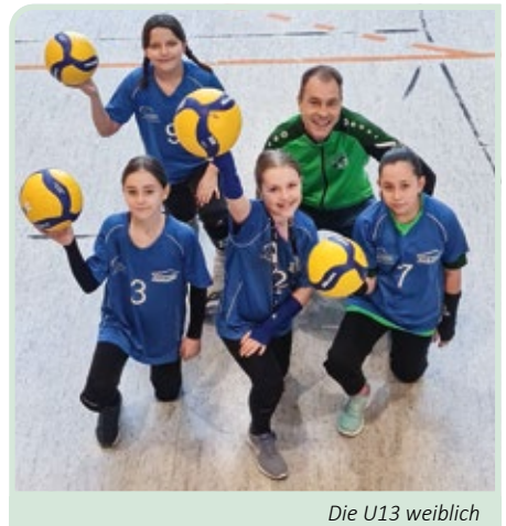
Die U13 weiblich